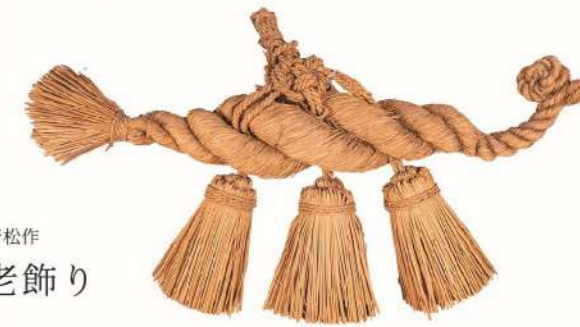
諏訪音松作 海老飾り

また、1F 烏山民俗資料館では、藁に関連した展示、『森を纏う 植物ファッション 自然が織りなす装い』と『米と飯 昔のお米とご飯の知恵』を開催していますので、併せて藁の魅力をお楽しみください。