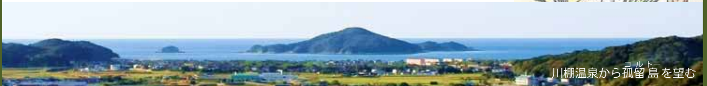
川棚温泉からコルトー島を望む